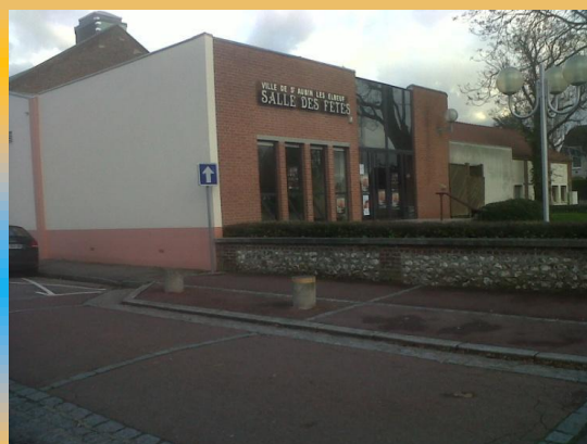
RUE LEON GAMBETTA